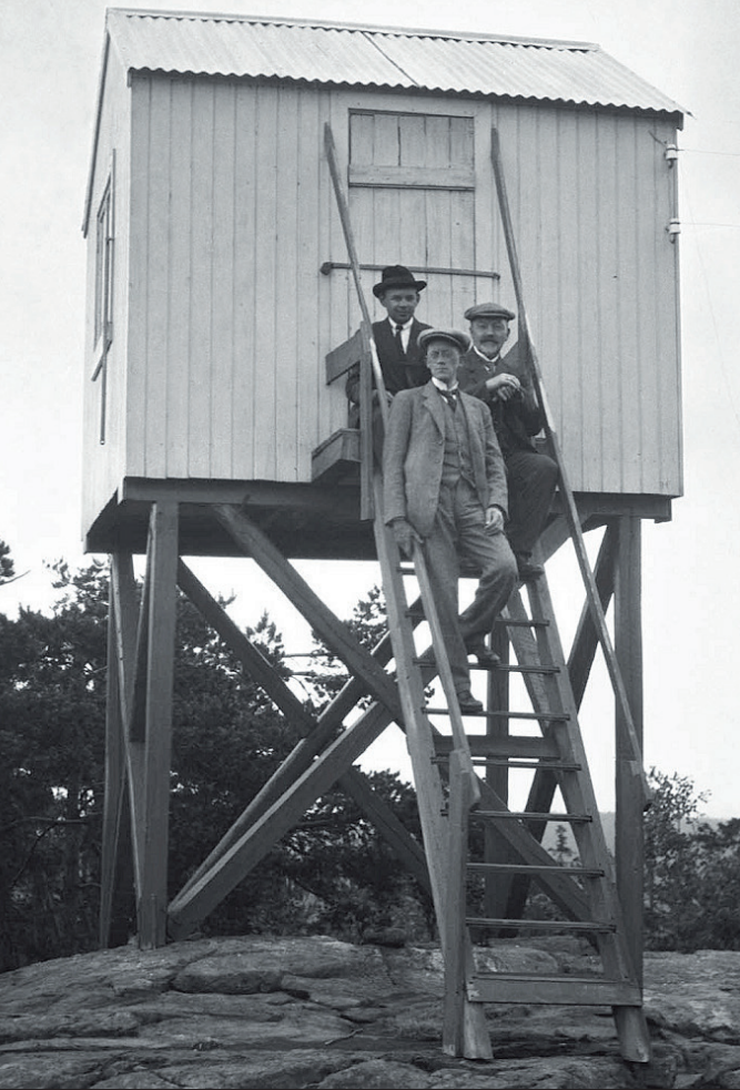
Skogbrands grunnleggere i brannvaktårn på Jeløen, 1912